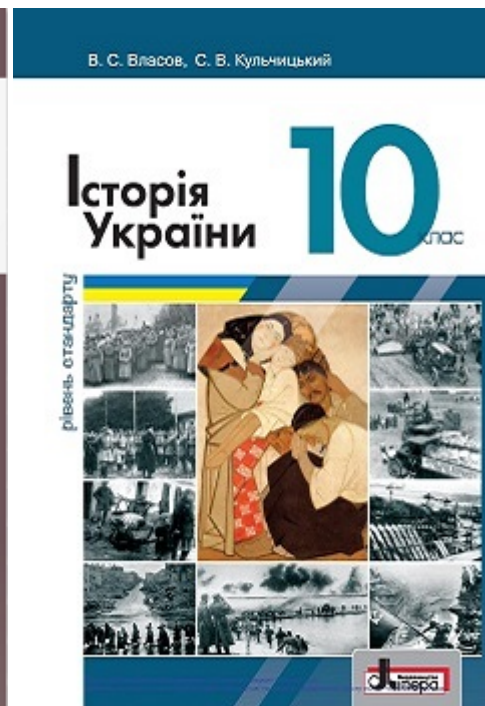
Учебники по истории Украины, где изложены события Холокоста

Я уверен, что даже немногочисленные гражданские проекты «спасут честь» Украины в деле мемориализации Бабьего Яра.