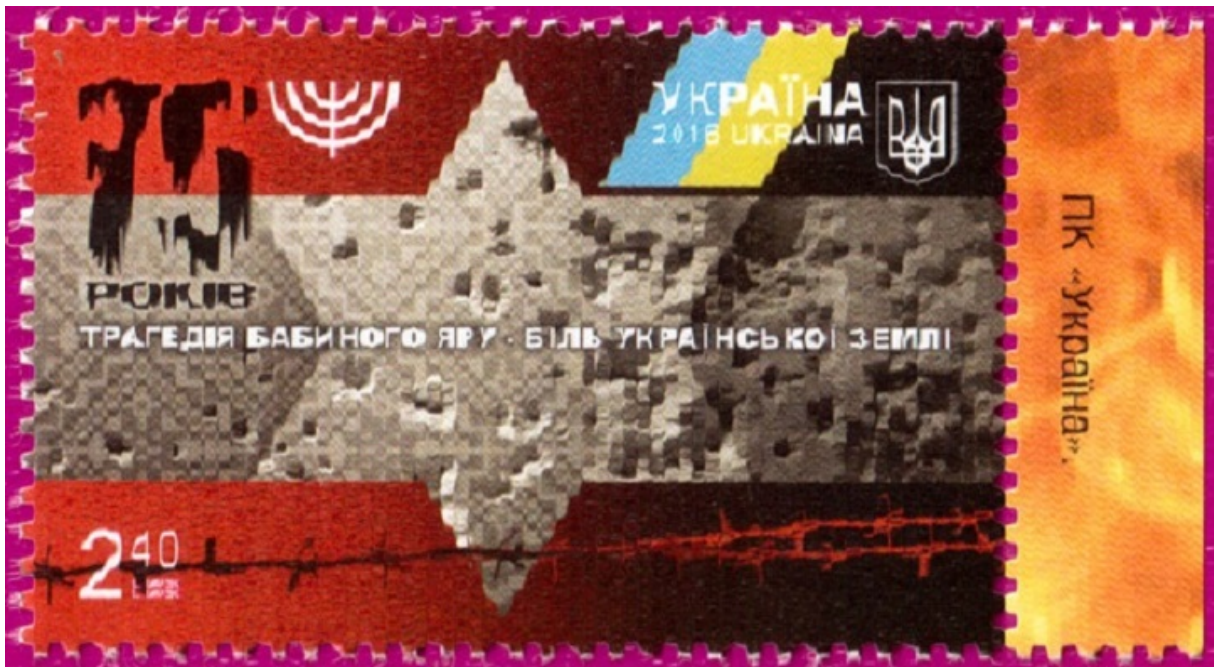
Марка, випущена к 75-летию трагедии Бабьего Яра