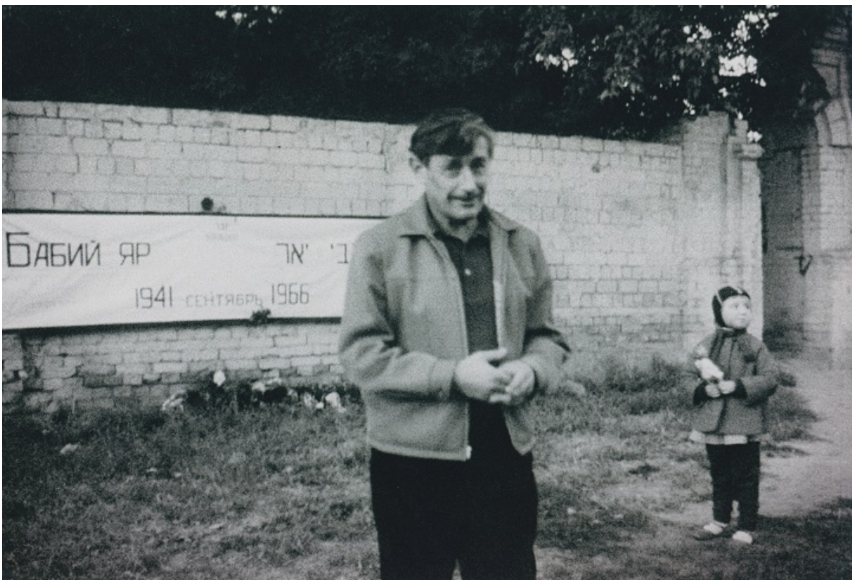
Виктор Некрасов в Бабьем Яру, 1966

Прежде всего, мы хотели включить трагедию Бабий Яр в исторический контекст, и в рамках многочасового марафона это вполне возможно. Историки, культурологи, эксперты расскажут о корнях нацистской идеологии, будет показан фильм Сергея Буковского «Назови свое имя», в основу которого легли свидетельства людей, переживших Холокост, отдельный блок посвятим борьбе за память о Бабьем Яре. Это и история попыток установить там памятник, и стихийные собрания, включая знаменитый митинг 1966 года, на котором выступали Виктор Некрасов и Иван Дзюба, и борьба еврейских активистов за увековечение памяти о трагедии, документы из секретных архивов, доносы в обком партии, КГБ, судьба книги Анатолия Кузнецова, поэзия на идише и украинском и многое другое.