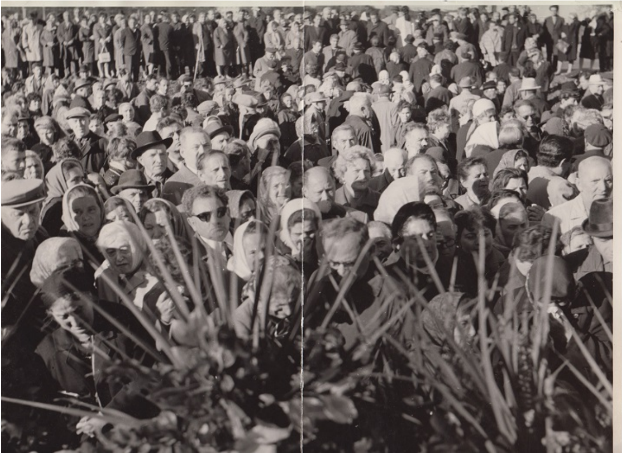
Нелегальный митинг в Бабьем Яру, 1960-е

Украина готовится отметить 80-летие трагедии Бабьего Яра — одного из символов Холокоста на территории бывшего СССР. Помимо государственной программы и визитов зарубежных лидеров, ряд инициатив готовят общественные организации, о чем мы беседуем с со-президентом Ваада Украины Иосифом Зисельсом.