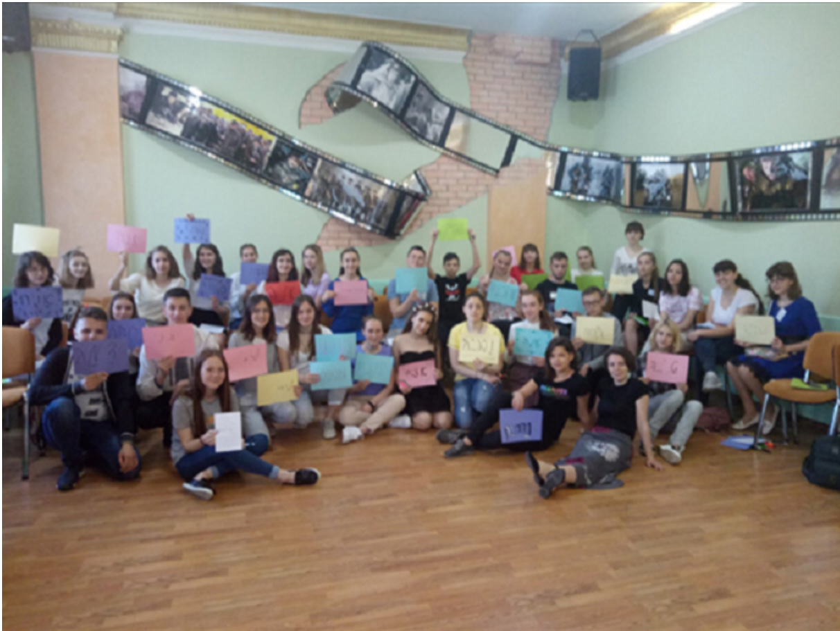
Участники одного из конкурсов «История и уроки Холокоста».

Таким образом, мы хотя бы отчасти попытались исправить перекос, дав возможность гражданскому обществу принять участие в подготовке и проведении мемориальных мероприятий к этой печальной дате.