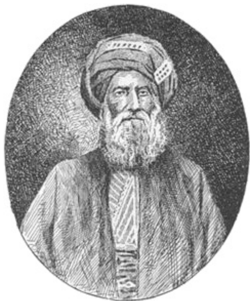
Давид Сассун — основатель знаменитой династии

Ганди указывал, что Индия и Южная Африка являются частью Британской империи, и надеялся, что обещанные свободы распространятся на индийских подданных, иммигрировавших в другую часть империи. В девяти выпусках Indian Opinion за 1906-07 гг. упоминаются законодательные маневры, связанные с идишем — Ганди был постоянно озабочен этим вопросом.