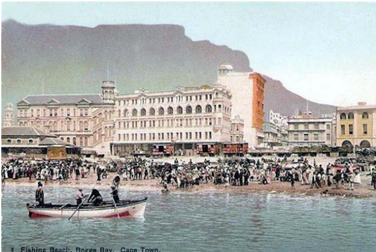
Кейптаун, нач. XX века