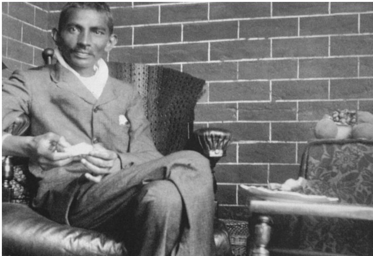
Махатма Ганди, Йоханнесбург, 1908

В начале прошлого века южноафриканские евреи активно боролись за признание идиша европейским языком. Почему? Таким образом, они пытались отделить еврейских иммигрантов, говоривших на идише, от выходцев из Индии и Китая.