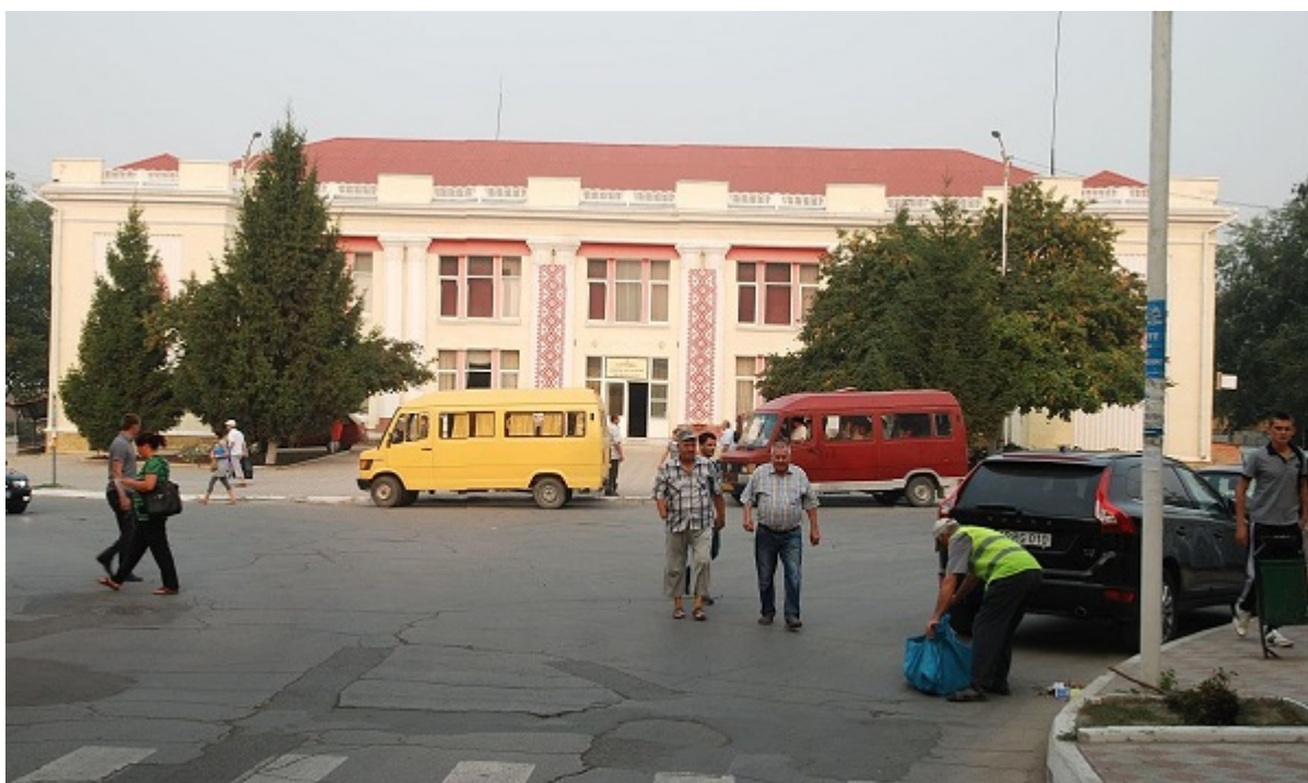
В центре Оргеева

В 2015 году, уже находясь под домашним арестом за свою предполагаемую причастность к крупнейшему банковскому мошенничеству в истории страны, Шор был избран мэром Оргеева — одного из десяти крупнейших городов Молдовы, в 30 километрах от Кишинева. В прошлом году Шор — 32-летний уроженец Израиля — стал депутатом парламента Молдовы, несмотря на решение суда, приговорившего его к 7,5 годам заключения. Многие считают, что он пошел в политику, дабы избежать ответственности за присвоение миллиарда долларов.