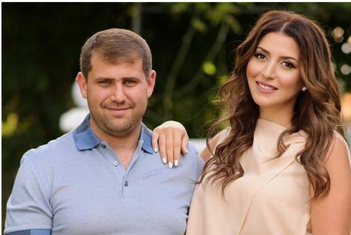
Илан Шор с супругой — российской поп-певицей Жасмин

В этом году, во время обжалования приговора, Шор ускользнул от местной полиции. Считается, что он живет в Израиле. Попытки JTA связаться с ним через его футбольный клуб и социальные сети, оказались безуспешными.