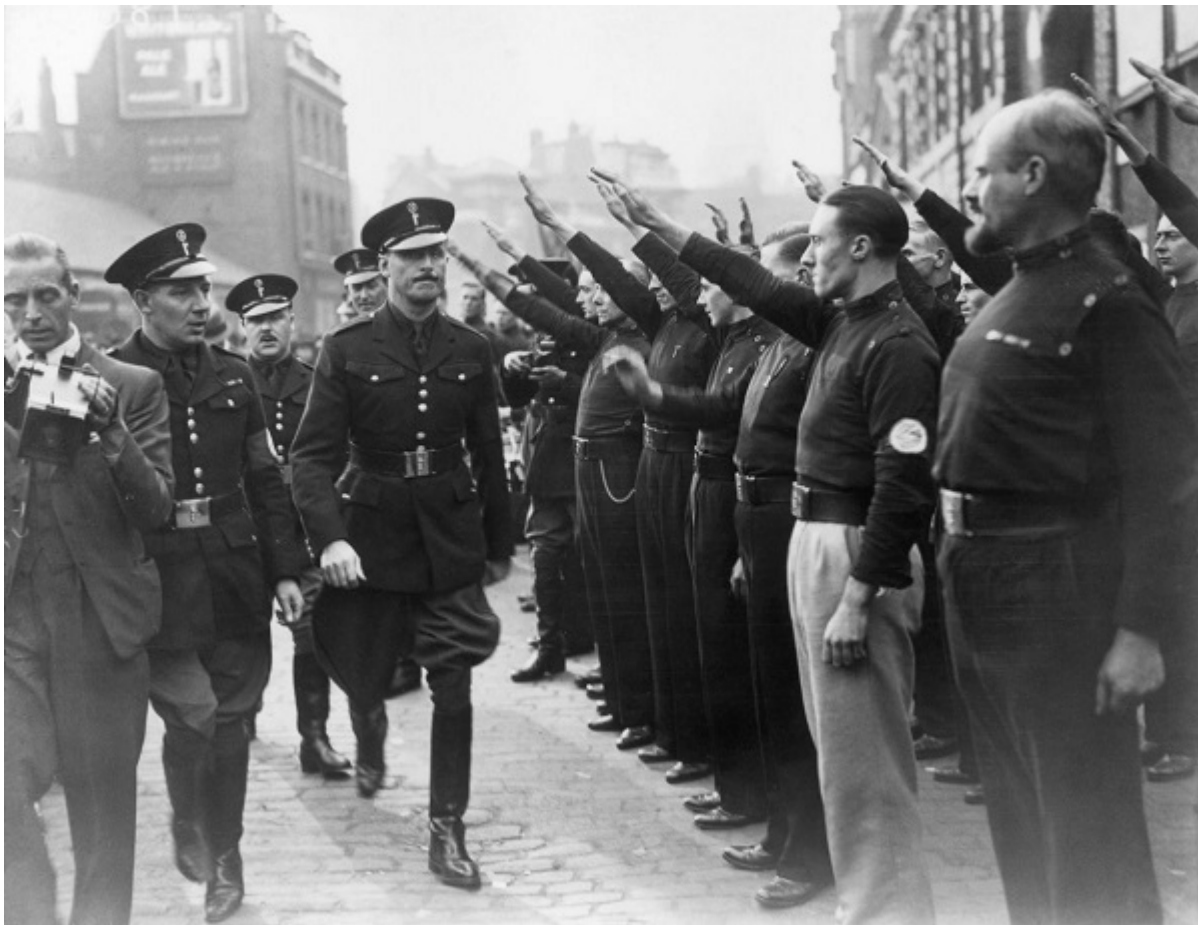
Освальд Мосли на параде Британского союза фашистов, 1930-е.

«Группа 43» превратилась из маленького союза бывших солдат-евреев, наслаждавшихся стычками с фашистами в лондонском Ист-Энде, где в то время еще жило большинство английских евреев — в сложную организацию, насчитывающую до двух тысяч членов, с департаментами разведки и наружного наблюдения.